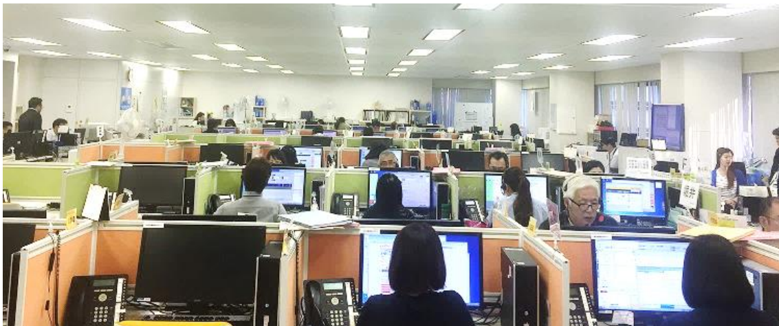
当社のコールセンター(大阪市中心部)

このたびの受賞を励みに、お客さま満足度の向上はもちろん、契約先企業様の業務改善・事業拡大にも貢献できるよう、さらなる品質の向上に努めてまいります。